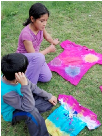
T-Shirts selbst batiken

Die Jahreszeiten sind in Peru genau umgekehrt zu denen in Deutschland. Was unsere Kinder in Munaychay am liebsten im Sommer mögen sind die Sommerferien - darin unterscheiden sie sich wahrscheinlich nicht zu den deutschen Schulkindern.