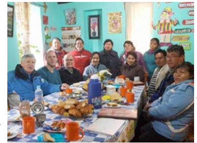
Besprechung in Munaychay

Sie trafen auf viele von den Ferien entspannte Kinder und wurden sehr herzlich begrüßt. Mittlerweile gehört die Begrüßungsfeier mit Tanz und Musik in der mitten in Munaychay gelegenen Casa Rodonda zur Tradition. Es ist für unsere Vorstandsmitglieder einerseits eine gute Gelegenheit anzukommen in der zwar bekannten, aber doch anderen Kultur. Auf der anderen Seite bleibt aber auch Zeit, die Entwicklungen und Fortschritte einzelner Kinder wahrzunehmen - was nicht als Kontrolle interpretiert werden darf, sondern als liebevolle Aufnahme eines Momentes. Denn in Deutschland besteht der Alltag doch zum größten Teil aus der Planung und Konzeption, aus Gesprächen mit Sponsoren und Spendern, aus Email-Korrespondenzen, sowie vielen Zahlen und Banktransfers. Das eigentliche Wohl der Kinder steht natürlich an erste Stelle, rückt jedoch neben den ganzen Formalien oftmals in den Hintergrund. Und genau das ändert sich schlagartig, wenn die Kinder ihnen ein persönliches Lächeln schenken, sie tanzen und miteinander fröhlich sind. Das sind die unbezahlbaren Momente, in denen man weiß, warum man seine Arbeit macht und sie auch gerne macht. Sie lassen den Stress des Alltags vergessen und den Sinn der Hilfe und Unterstützung deutlich werden.