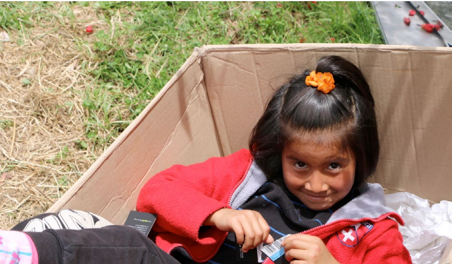
Spielen in Munaychay