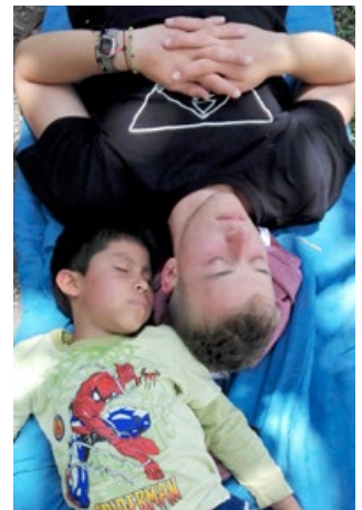
Seele baumeln lassen

In Peru dauern die Ferien fast drei Monate. Drei Monate spielen, Seele baumeln lassen und sich den schönen Dingen des Lebens widmen. Ein paar Kinder haben das Glück, die Ferienzeit in ihren Familien zu verbringen. Unsere Freiwilligen haben während dieser Zeit allerhand zu tun. Denn sie gestalten jedes Jahr ein Ferienprogramm. Da planen und begleiten sie die Kinder bei ihrem Jahresausflug - neben Weihnachten ein Höhepunkt für die Kinder. In diesem Jahr fuhren alle Kinder, ihre Tias und Betreuer nach Cocalmayo. Dort konnten sie in einem Naturschwimmbad mit warmen Wasser schwimmen und plantschen. Abends übernachteten alle in Zelten. Die fünf-stündige Rückfahrt haben fast alle verschlafen.